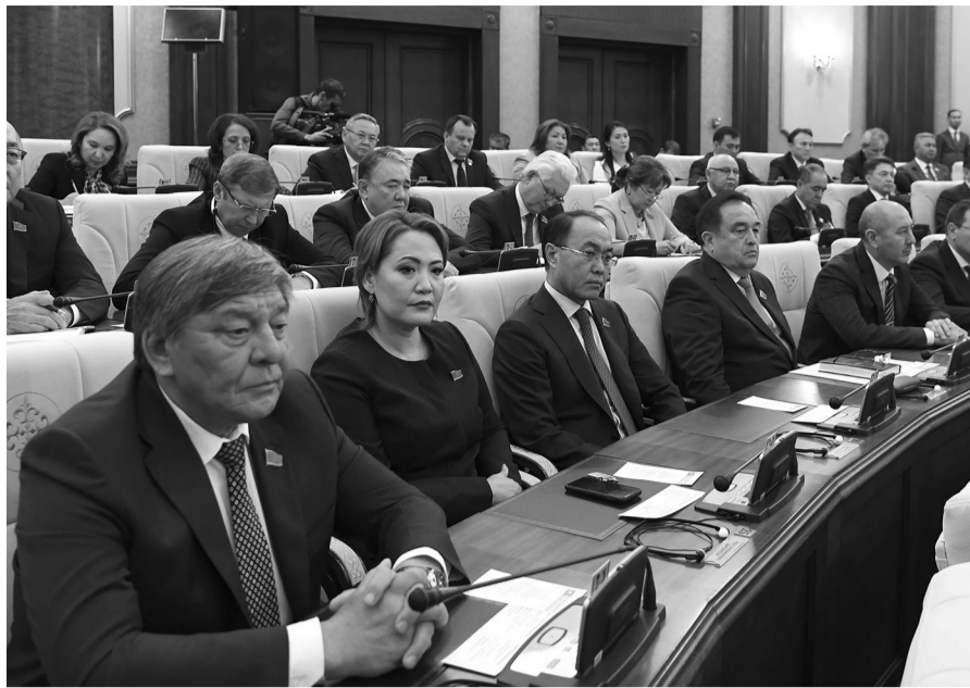
(Жалғасы. Басы 1-бетте.)

Президент Әкімшілігінде азаматтардан келіп түскен өтініштерді мемлекеттік органдардың сапалы қарауын қадағалап, жедел шаралар қабылдайтын бөлім құрылды.