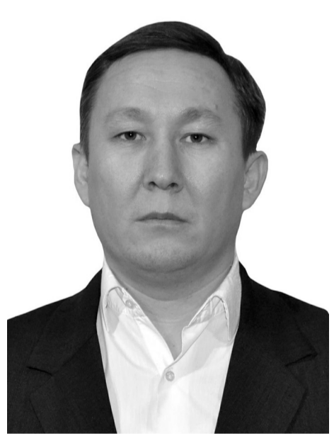
Президент Жолдауында қазіргі әлеуметтік-экономикалық жағдайға жан-жақты, терең талдау жасалған және оны түбегейлі оңалту бағытында нақты міндеттер қойылып отыр.

Осындай жақсы жаңалықтарға толы Жолдауды жариялап, халқының қамы үшін небір иі бастамалар көтеріп жатқан кемел