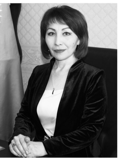
Президент Қ.Тоқаевтың елдің ықыласына бөлене берері хақ.

жеткілікті түрде көңіл бөлмей отырмыз. Бұл – ең алдымен кітапхана, музей, театр қызметкерлеріне қатысты мәселе. Олардың еңбекақысы соңғы жылдары мүлде көбейген жоқ. Соның салдарынан мәдениет қызметкерлері, әсіресе жас мамандар жеңілдігі бар тұрғын үй бағдарламаларына қатыса алмайды. Мұндай ахуал осы кәсіптің беделін түсіріп, лайықты кадрлардың тапшылығы айқын сезіледі» деген Жолдаудағы сөздері мәртебеімізді бір көтеріп тастады. Әркімнің бір «жұлдызы жанатын күні» болады демекші, 2020 жылды мәдениет саласы қызметкерлерінің «айы оңынан туған» жыл болды деп, тарих қойнауына жіберсек, нұр үстіне нұр болар еді.