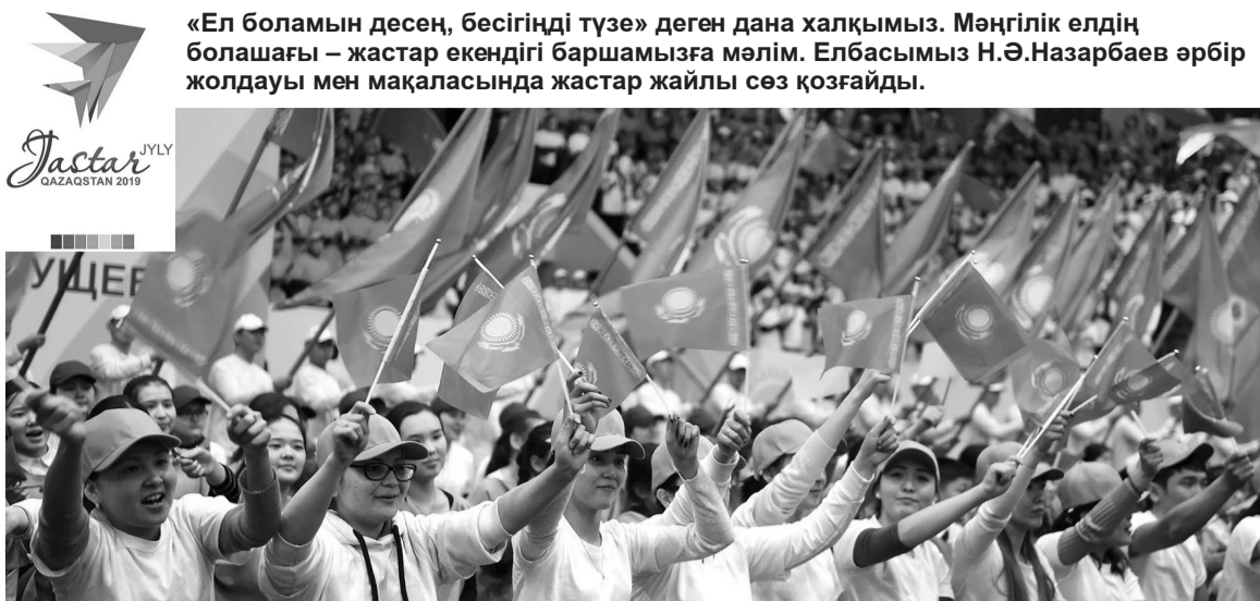
«Ел боламын десең, бесіңді түзе» деген дана халқымыз. Мәңгілік елдің болашағы – жастар екендігі баршамазға мәлім. Елбасымыз Н.Ә.Назарбаев әрбір жолдауы мен мақаласында жастар жайлы сөз қозғайды.