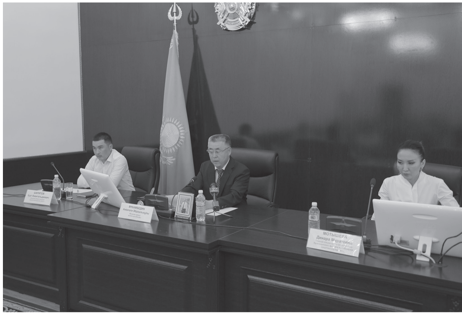
кәсіпкерлер бұл бағдарламаға қатыса алмайды. Мал басын көбейтуді мақсат тұтқан шаруа қожалықтары үшін мал сатып алуда шектік бағалар белгіленген. Мысалы, шетелден жеткізілетін ірі қараның құны 750 мыңнан аспауы керек. Малдың бағасы әкелінетін еліне қарай өзгеріп отырады.