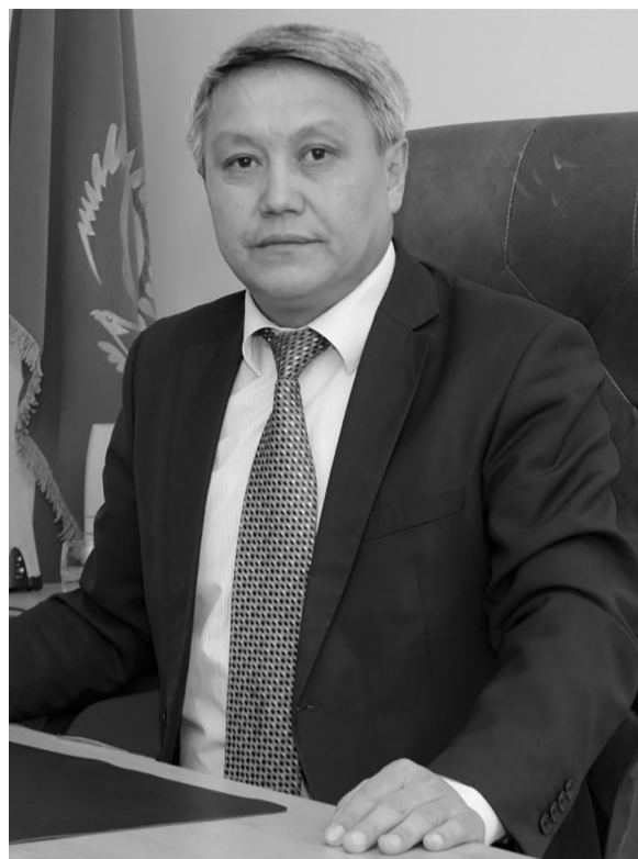
кеттік тіл мәселесі толық шешілген. Өз ана тілін білмейтін өзербайжан жоқ. Соның өзінде олар төртінші мәрте жаңа емлені қабылдады.

– 1929 жылы Қазақстан Орталық кеңес комитетінің IV сессиясының қаулысымен қазақ тілі латын графикасына көшірілді. Осы кезеңдегі елдің латынға көшу жағдайымен, халықтың білім деңгейімен, көзқарасымен, бүгінгі уақытты салыстыра алмайсыз. Шындығына келгенде, ортақ емле жасау өте қиын.