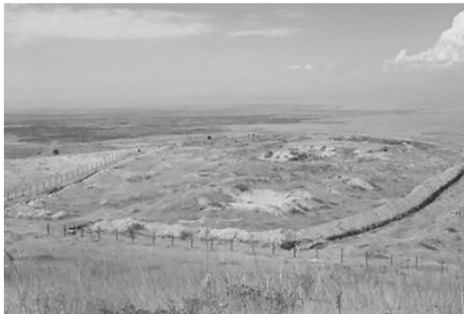
тұсында орналасқандығымен маңызды. Қазақ хандығының тірегі ретінде Созақтың маңызды орталық болғандығын көруге болады.

Ал қаланың нағыз көркейген тұсы Қазақ хандығының құрылғандығымен тығыз байланысты. Археолог Ақышевтің мәліметінше, Созақ қаласы арқылы хандықтың басты қалаларына апаратын Суындық, Ақсүмбе секілді асулар өткен.