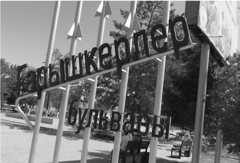
мекемелерден ләм-мим деген кесімді пікір болмады. Қала тұрғындары да бұл мәселеде белсенділік танытып дей алмаймыз. Кеше «Арбаты» ауызға алғанда осы жай еріксіз еске түскен еді.

Жезқазғанның 65 жылдығы қарсаңында қайта жөнделген Ғарышкерлер бульвары жаңа кейіпке өніп, гүлдене түсті. Жасыл желек көмкерген бұл гүлзар бұрыннан да жезқазғандықтардың сөйлідеп, демалатын сүйікті орны болатын. Енді әртүрлі жастағы балаларға арналған кешенді ойын алаңдары, «Скейт-парк» (Skatepark) мәдени-сауықтыру көшені, велосипедшілер мен жаяу жүргізушілерге арналған жол, арт-нысандар мен мүсіндер сияқты көптеген игіліктермен жабдықталып, көркейген бульвар қала тұрғындарына ерекше қуаныш сыйлайтыны анық. Жаңарған баққолдың ашылу салтанатында ізгі тілектер көп айтылды. Шаттанған қуаныш үстінде бұл алаң «Арбатқа айналады» деген лөбіз де айтылып қалды. Осыны іліп әкеткен кейбір БАҚ құралдары «Жезқазғанның өз Арбаты бар» деп жалғанға жар сала хабарлап жатты. «Арбатқа сонша неге арбалдық?» деп ойландық осы тұста.