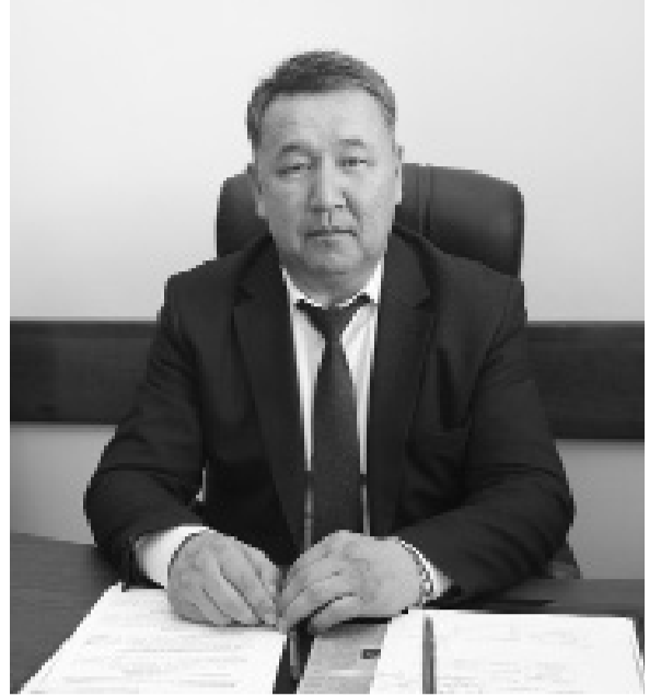
Жоғарыда аталып өткен білім саласындағы реформалардың түгелі дерлік еліміздің болашағы саналатын өскелең ұрпақтың білімді әрі бәсекеге қабілетті шығармашыл тұлға ретінде қалыптастыру мақсатында жүзеге асырылып жатқаны белгілі. Сондықтан, сапалы білім беру арқылы адами капиталды дамытуды мақсат тұтқан еліміздің болашағы кемел боларына сенім мол.

Бұл сала материалдық техникалық базаны нығайтуды талап етеді. Сол мақсатта 2018 жылы сыныптар арнайы парталармен, сенсорлық бөлмелер, оқу-әдістемелік құралдармен жабдықталды. Барлық білім ұйымдарында толық қолжетімділікті қамтамасыз ету үшін кезең-кезеңмен кіреберістегі пандустар қайта жаңартылуда.