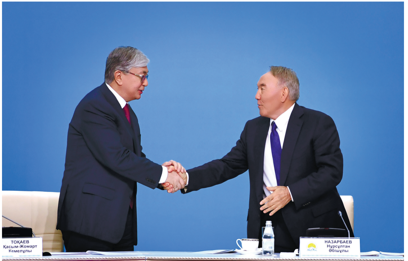
ТОҚАЕВ Қасым-Жомарт Кемелұлы

Нұрсұлтан Назарбаев Қасым-Жомарт Тоқаевты еліміздегі жоғары