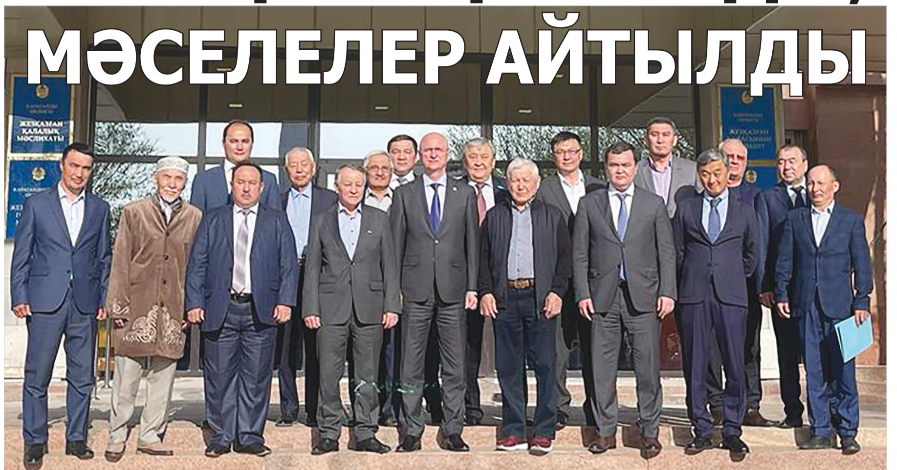
Еститін мемлекеттің жоғары деңгейдегі басшыларының Жезқазған жұртышылығына уәде беріп, аттанып бара жатқан сәті.

Қарағанды облысының құрамынан жаңадан ашылатын Ұлытау облысын болу барысында орын алып отырған олқылықтарға байланысты Жезқазған-Ұлытау аймағының халқы наразы көңіл-күйде отырғаны бүгінде ешкімге де құпия емес. Осыған байланысты откен аптада аймақтың бір топ белсенді азаматтары халықтың талабын тиісті лауазым иелеріне жеткізген болатын. Нәтижесінде Қарағанды облысының әкімі Жеңіс Қасымбектің қолдауымен Қазақстан Республикасы Премьер-министрінің бірінші орынбасары, ашылатын облыстарға байланысты құрылған үкіметтік комиссияның төрағасы Роман Склярмен Жезқазған қаласында кездесу өтті.