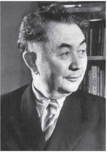
«Бүгінгі күнді түсініп-түйсіну үшін де, болашақтың дидарын көзге елестету үшін де кешегі кезеңге көз жіберіңіз»