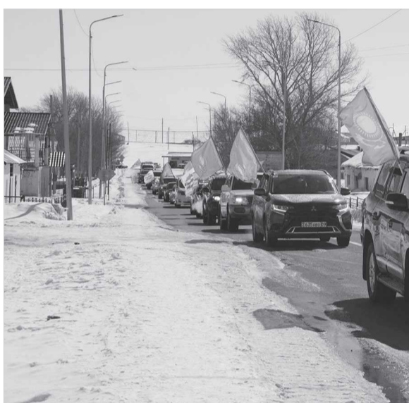
ды. Сөйтіп, 21 наурыз күні Жезқазған қаласынан шыққан автошеру Сәтбаев қаласы мен Жезді кенті

Солдай болды да. Жезқазған, Сәтбаев қалалары мен Ұлытау ауданы, Жезді кентінің белсенді, патриот азаматтарынан құрылған бастамашыл топ жаңа облысты ұлықтауға арналған автошеру ұйымдастырды. Оны қала, аудан әкімдері де қолда-