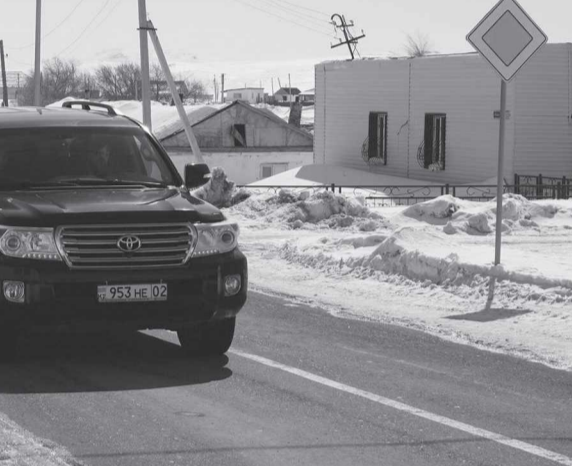
арқылы өтіп, ұлт ұясы – Ұлытауға атбасын тіреді. 50-ге жуық автокөлік қатысқан шеру Ұлытау