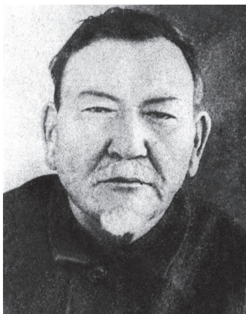
«Халық жазуы» деген нақақ жаламен ұсталып, Мәскеудегі Бутырка түрмесінде атылған Ахмет Байтұрсынұлының абақтыда жатқан кезіндегі фотосуреті