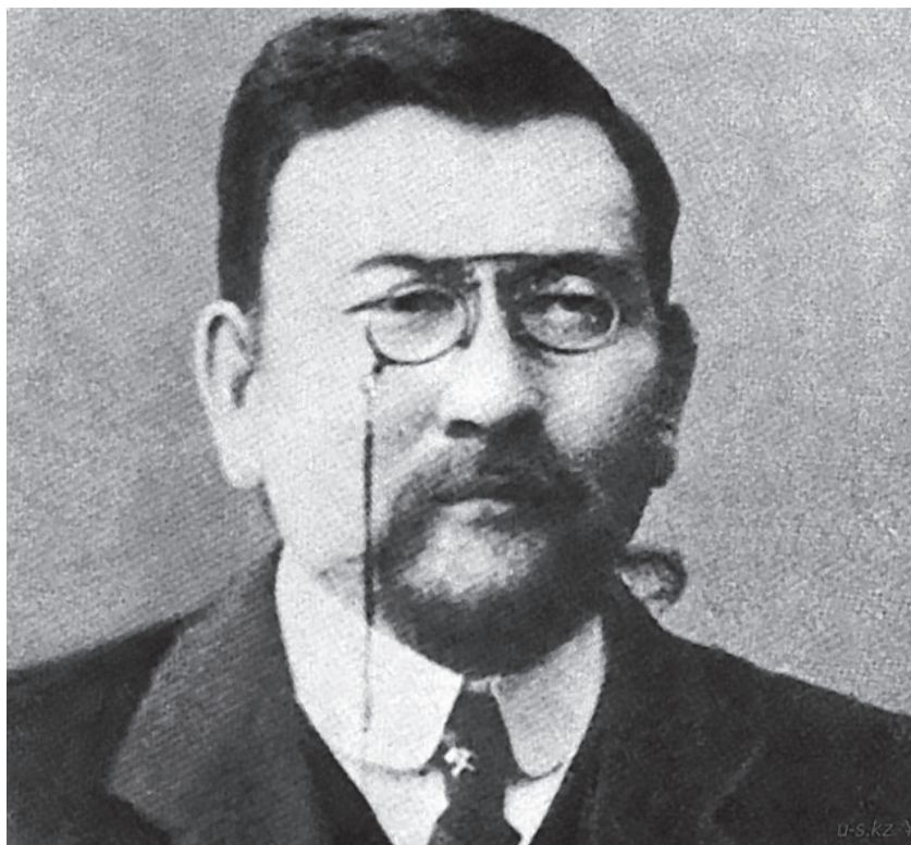
2018 жылдан бері 5 қыркүйек – Қазақстан халқы тілдері күні болып атап өтіліп келеді. Айта кету керек, бұған дейін 22 қыркүйек күні, кейінірек қыркүйек айының үшінші жексенбісі Тілдер мерекесі деп белгіленіп, кәсіби мерекелер тізіміне енгені белгілі.

ҚР Премьер-Министрінің 2017 жылдың 31 қазаны күнгі «Қазақстан Республикасында мереке күндер тізбесін бекіту туралы» №689 қаулысымен «5 қыркүйек – Қазақстан халқы тілдерінің күні» болып бекітілді. Халқымыз үшін айрықша маңызы бар бұл мерекенің 5 қыркүйекке ауыстырылуының себебі бар.