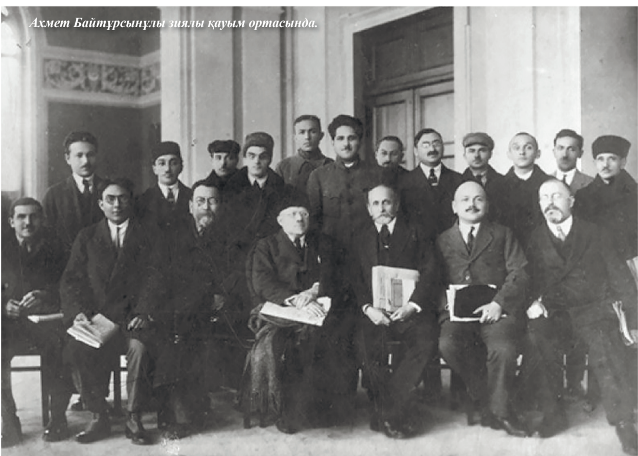
Ахмет Байтұрсынұлы зиялы қауым ортасында.