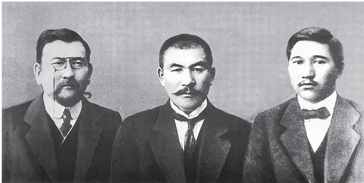
«Алаш» қайраткерлері Ахмет Байтұрсынұлы, Әлихан Бөкейхан, Міржақып Дулатұлы.

А.Байтұрсынұлының қазақша әліппесі мен қазақ тіліндегі оқулықтарды жазуды 1910 жылдардан бастап қолға ала бастайды.