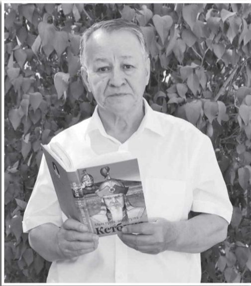
— Баба бейнесі — бізбен бірге — Тарихта Кетбұқа есімді талай кесек тұлға болғанын білеміз. Жалпы мәліметке жүгінсек, ұзын-ыргасы жиырмаға жетіп жығылады, арасында осалы жоқ. Міне, тарихи-ғалым біткен қаламын бөзеп, пікірталас қызған тұста қаймықпай керегесін жайып, шаңырағын көтерген қоғамдық бірлестікке қиындық кездескен жоқ па?

— Мұндай жауапты қадамды аяқ астынан атандамай, жан-жақты дайындықпен жасадық. Қоғамдық бірлестік құрылғасын даңқты тұлғаның есімін, ерлігін дәріптеу, жұртшылыққа кеңінен таныстыру мақсатында Жезқазған қаласының Құрметті азаматтары жергілікті газетте үндеу жариялады. Қоғамдық бірлестіктің белсенді мүшелері мекемелер мен оқу орындарында көптеген кездесу өткізді. Өртүрлі деңгейдегі газет-журналда бірнеше мақала басылды. Хабары Қазақстанға тарихи жергілікті «Дидар» телераионы тарихи-танымдық хабарлар, кездесулер мен дөңгелек үстелдер ұйымдастырды. Жезқазған қалалық «Нұр Отан» партиясы ғимаратында «Кетбұқа — жырау, аталық, қолбасшы» деген тақырыпта жас ғалымдардың республикалық ғылыми-теориялық конференциясын өткізді.