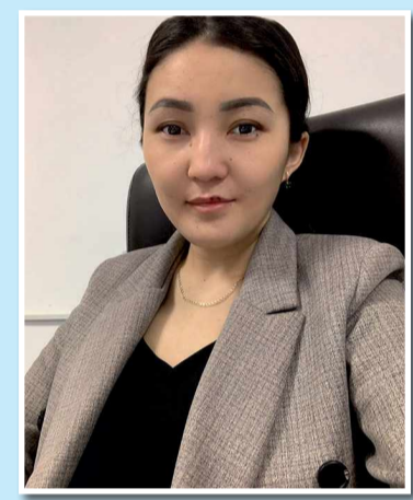
тұғыры биік, мәртебесі жоғары болуын әрдайым аналық тілегіне қосып отыратын ол Ұлы Дала төсіндегі «Мәңгілік елдің» келешегі кемел боларына сенеді.