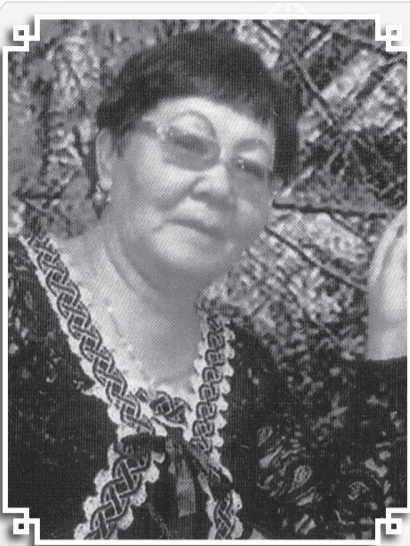
Сұрайсың-ау білгің кеп халімді, адам, Мен қазақтың қызымын жсалындаған. Жетім жүрпін қиындық көрсем дағы Басымды шп ешкімге жалынбаған.

Қиындықты жасымнан көп көргенмін, Сағынышты жүрекпен өткергенмін. Болашаққа болжаммен аттанып ем Көремді бүгін жемісім төккен төрөмін.