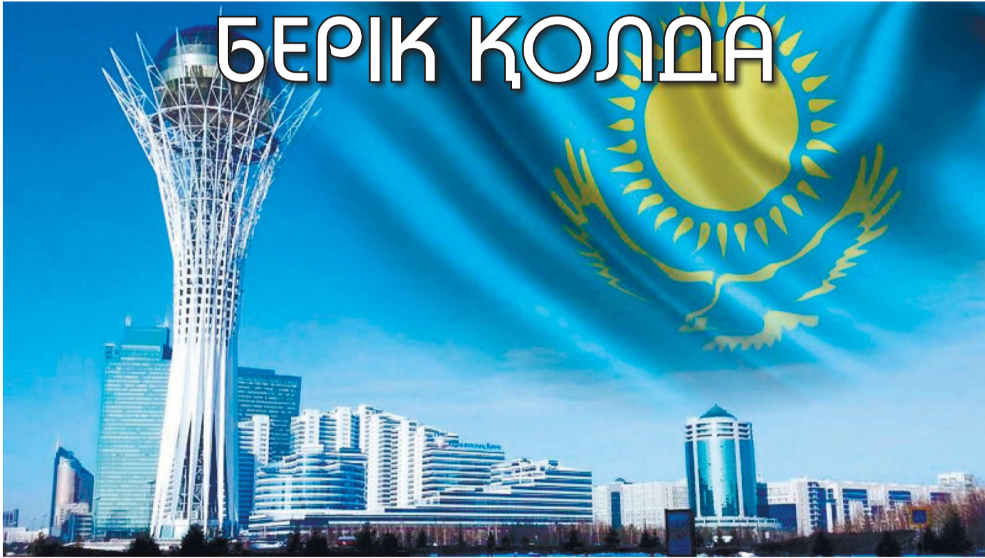
1991 жылғы желтоқсан айының 10-шы жұлдызы болатын. Республика сарайында бүкіл халық сайлаған Қазақстанның тұңғыш Президенті Н. Назарбаевтың қызметке кірісуіне байланысты болатын салтанатты мәжіліске шақырту қағазын алған едім. Уақытында сарайға келдім. Таңертең ғана Парламент мемлекетімізді Қазақстан Республикасы деп атау жөнінде Заң қабылдаған. Енді ықпалы заманнан бері тарихта алғашқы сайлаған халық Президенті таққа отырғалы отыр.

Егемендік алған жас мемлекеттің ертені қандай, басқа қонған бақ баянды бола ма, еңсемізді көтеріп, өркеніетті демократиялық қоғам құра аламыз ба деген сұрақтар көңілімізді кеудеп тұрған.