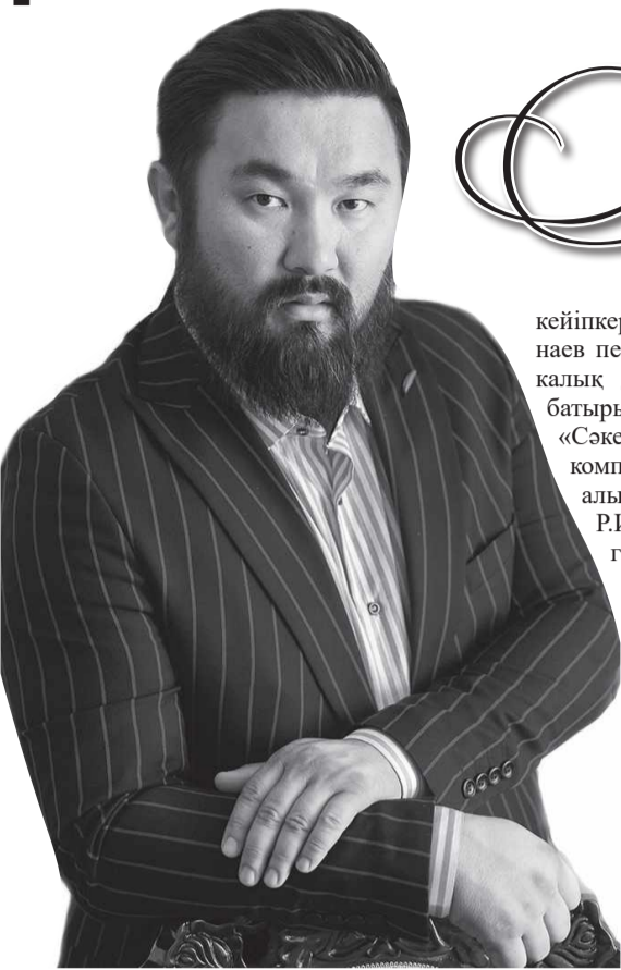
(Соңы. Басы 1-бетте).

Колледждің актерлік бөлімін 2013 жылы бітірушілердің дипломдық жұмысы болған Э.Шмиттің «Тәңірге хатында» Ардақ балалар клиникасында жатқан наука бала – Поп–Корн рөлін сомдады. Бұл оның үлкен сахнадағы алғашқы рөлі болатын. Осы жылы орта арнаулы біліммен шектеліп қалмауды жөн көріп, Бішкектегі Б.Бейшеналиева атындағы өнер институтының актерлік бөліміне түсіп, 2017 жылы ойдағыдай бітіріп шығады.