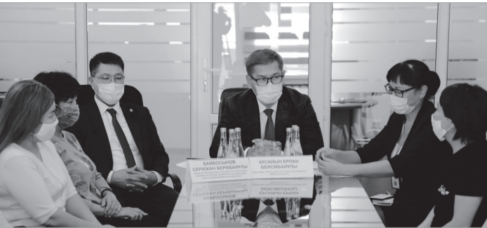
– Ведомствоаралық комиссияның Жезқазған, Сәтбаев, Қаражал, Жәйрем өңірлеріне арналған сапары нәтижесінде осы аймақтардағы халықтың әлеуеті анықталып, болашақта атқарылуға тиісті жұмыстар тізімі әзірленеді.