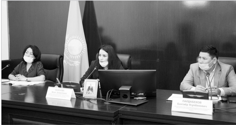
хакында айтуды сұрады.