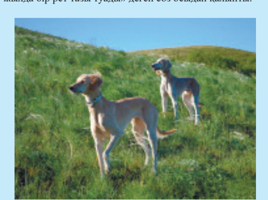
«Экософия немесе киелі табиғат» кітабынан

Содан бастап түркілер тазы мен құмай асырай бастапты. Тазы самұрықтан тұғасын өте жүйрік келеді. Одан, тіпті, ұшқан құс та тірі құтылмайды. Бірақ, тазы жерді мекендегенін, қаны тез бұзылады екен. Ал құмай Алтай тауында мекендеп жүре береді. Ол тазының тұқымы әлсірей бастағанын сезсе, өзінің бір жұмыртқасынан күшік өсіріп шығады. Сол күшік кейін тазы болады. «Құмай құс жүз жылда бір рет тазы туады» деген сөз осыдан қалыпты.