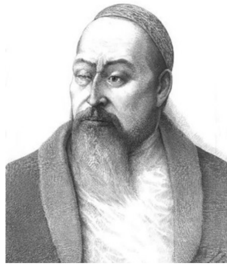
Абай атамның бойы да еңселі болып шығады және орта бойлы дегенге келмейді.

Әкесінің ат жақты келген, ұзын сопақ басының құлақтан жоғары жері қаз жұмыртқасындай көрінді. Онысыз да ұзын, үлкен бетіне, ұп-