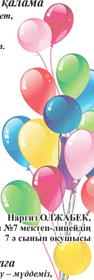
Наргиз ОЛЖАБЕК, Қ.И.Сәтбаев атындағы №7 мектеп-лицейдің 7 э сынып оқушысы

Тазалық бер суымызға, Көркею бер нуымызға. Несібе бер көлімізге, Береке бер жерімізге.