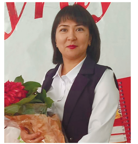
Өр шәкіртін аялар арда ұстазым, Ғұмыры боп, шаттықты боп жүргейсін.

Ұстазға жан бар ма екен бас имейтін, Ұстаз – емші, білімнен емдейтін.