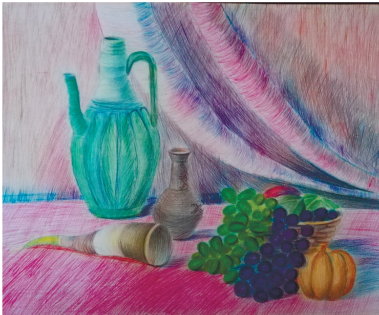
Саруар НҰРАСЫЛ, Қ.И.Сәтбаев атындағы № 7 мектеп-лицейдің 6-сынып оқушысы