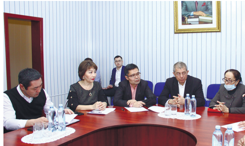
Алтын Орданың 750 жылдық мерейтойы Жезқазған тарихи-археологиялық музейіндегі «Тарих тұнған Алтын Орда» тақырыбындағы дөңгелек үстелге арқау болды.