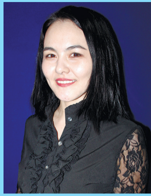
Ізгі тілекпен, Музей ұжымы.

Сізді 30 жас туған күніңізбен құттықтаймыз! Шын жүректен әлемнің бар жақсысы мен асылы, қуанышы мен бақытын тілейміз! Іс табысты, денсаулық мықты болсын! Отбасыңыз, туған-туыс, дос-жаран, ұжым ортасында сыйлы болып, абыройыңыз арта берсін!