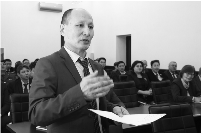
Қайрат Баяндыұлы есебінде соңғы жылдары қала экономикасында өсім байқалатынын айтып, бірқатар бағыттар бойынша жоғары көрсеткіштерді тізіп өтті.

Жезқазған қаласының әкімі Қайрат Бегімов қалалық қоғамдық кеңес алдында өткен жылы атқарған жұмыстары жөнінде есеп берді.