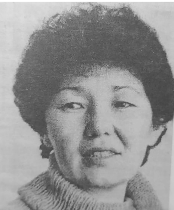
16 жыл! Менің студияға келіп, еңбек ете бастағаным да 16 жыл уақыт болыпты. Уақыттың осы зымырап

(Телеарнаның 30 жылдығында жазылған естелік)