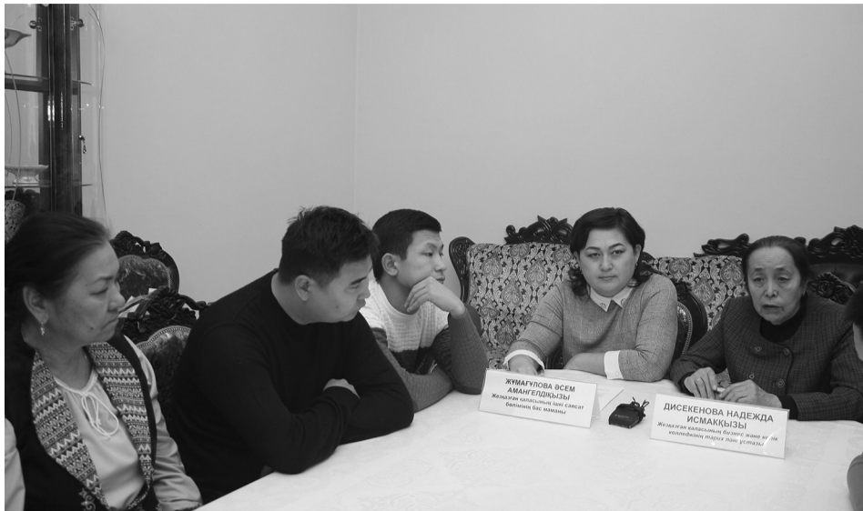
Qazaqstan Respublikasy Prezidentiniñ Joldaýy

Президент Қасым-Жомарт Тоқаевтың «Сындарлы қоғамдық диалог – Қазақстанның тұрақтылығы мен өркендеуінің негізі» атты қазақстандықтарға Жолдауы С.Қожамқұлов атындағы Жезқазған қазақ музыкалық-драма театры ұжымына да түсіндірілді.