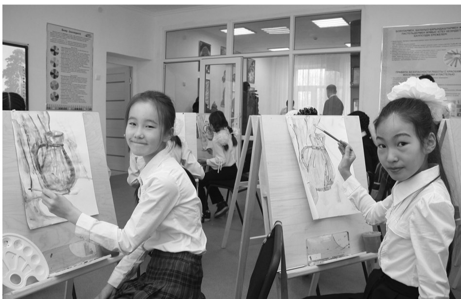
(Соңы. Басы 1-бетте)

Сондай-ақ, орталықта техникалық бағыттағы «СТЭМ-лабораторияда да» шәкірттер даярлануда. Бұл жерде қала жастары «Robo Land», «Robo Kids», «Робототехника», «Эко-модельдеу» үйірмелеріне қатысып, өздерін ұшқырлық-танымдық тұрғыдан дамыта алады. 3D-принтер арқылы бұйымдарды ойдан шығару және құрастыру жұмыстарымен айналысып жатқан жастар жұмыстары көз кұантады. Және аталмыш орталықта қазақтың ұлттық аспабы домбыра үйрену мүмкіншілігіне де қол жеткізуге болады.